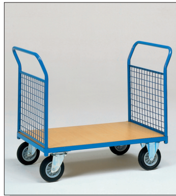
Skyvetralle m/netting endegavler