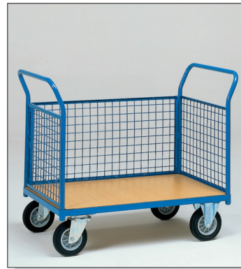
Skyvetralle m/3 netting sider