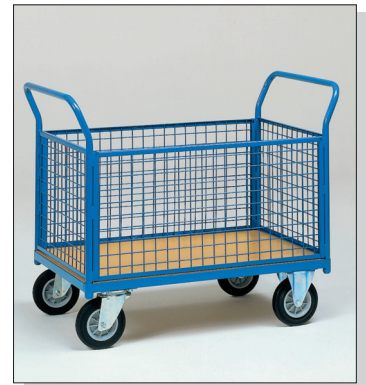
Skyvetralle m/4 netting sider